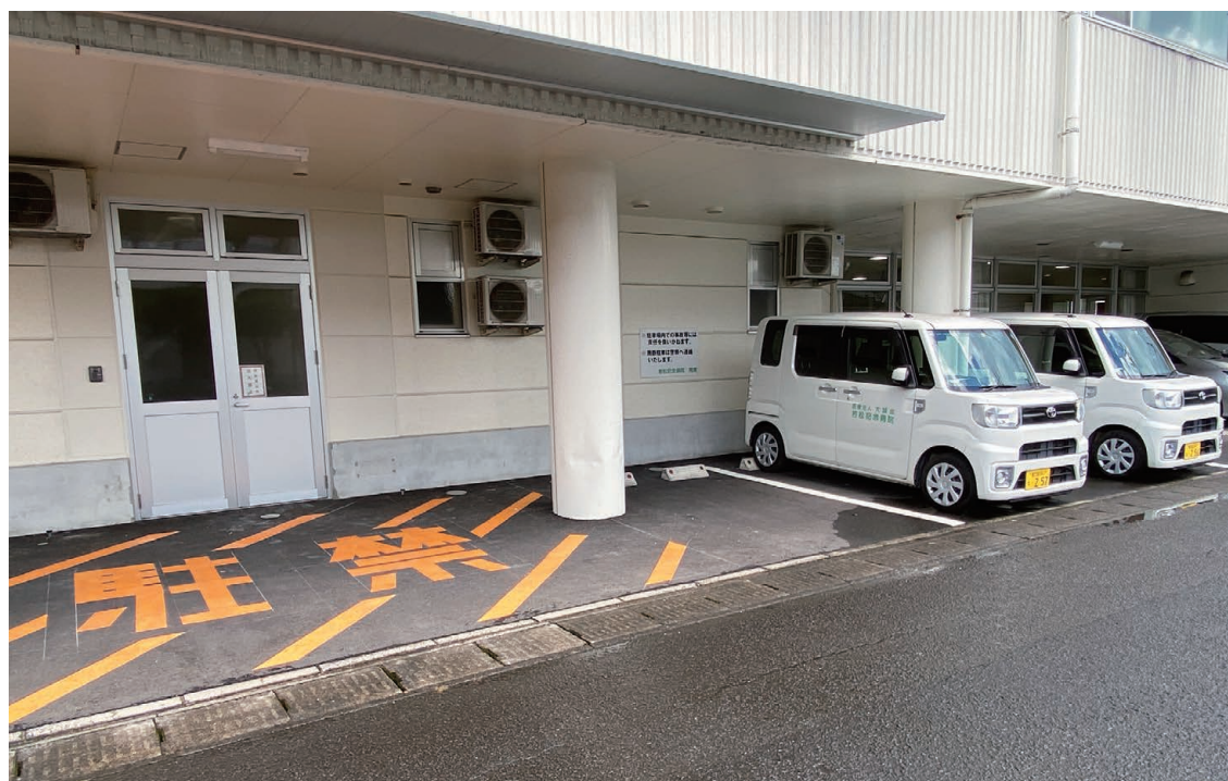
令和4年2月に救急車等の搬入口を整備しました