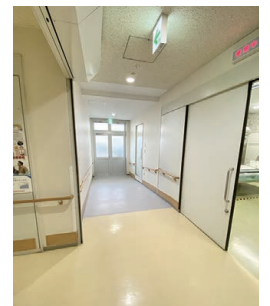
完成後の救急搬入口