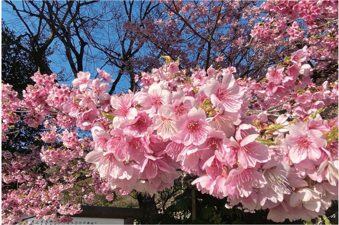
2月下旬の藤川天神（東郷町）