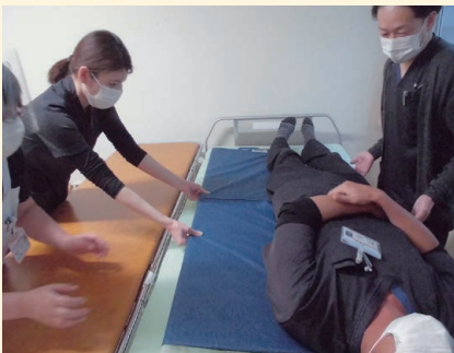
スライディングボードの練習の様子

年々介護の器械も発展してきているので、病院に導入できる物は少しずつ取り入れ、患者さんにより安全に、そして職員にとってもより働きやすい職場になればと考えています。